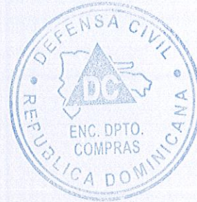
Melvin Rondon Brito Encargado de Compras. Defensa Civil

parlante de 100 watts 6 tonos, luces laterales y traseras, sirena 6 tonos con altoparlante.